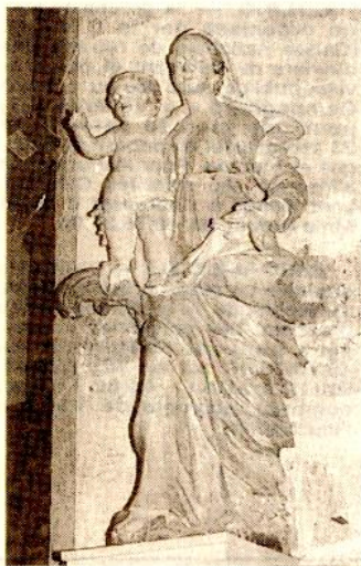
L'une des curiosités intérieures : une statue en bois, polychrome du XVII e siècle, représentant la Vierge et l'enfant